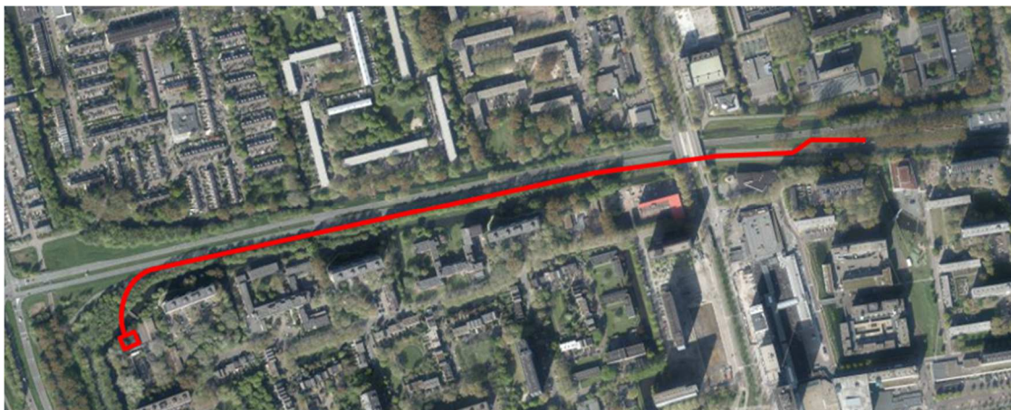
Figuur 1: Indicatieve weergave van de situatie

Het Project betreft het in bouwteamverband voorbereiden, met de intentie tot realiseren, van de noodzakelijke maatregelen aan het hoofdrioolgemaal, de persleiding en het inkomende vrijvervalriool binnen de grenzen van het Project (figuur 1).